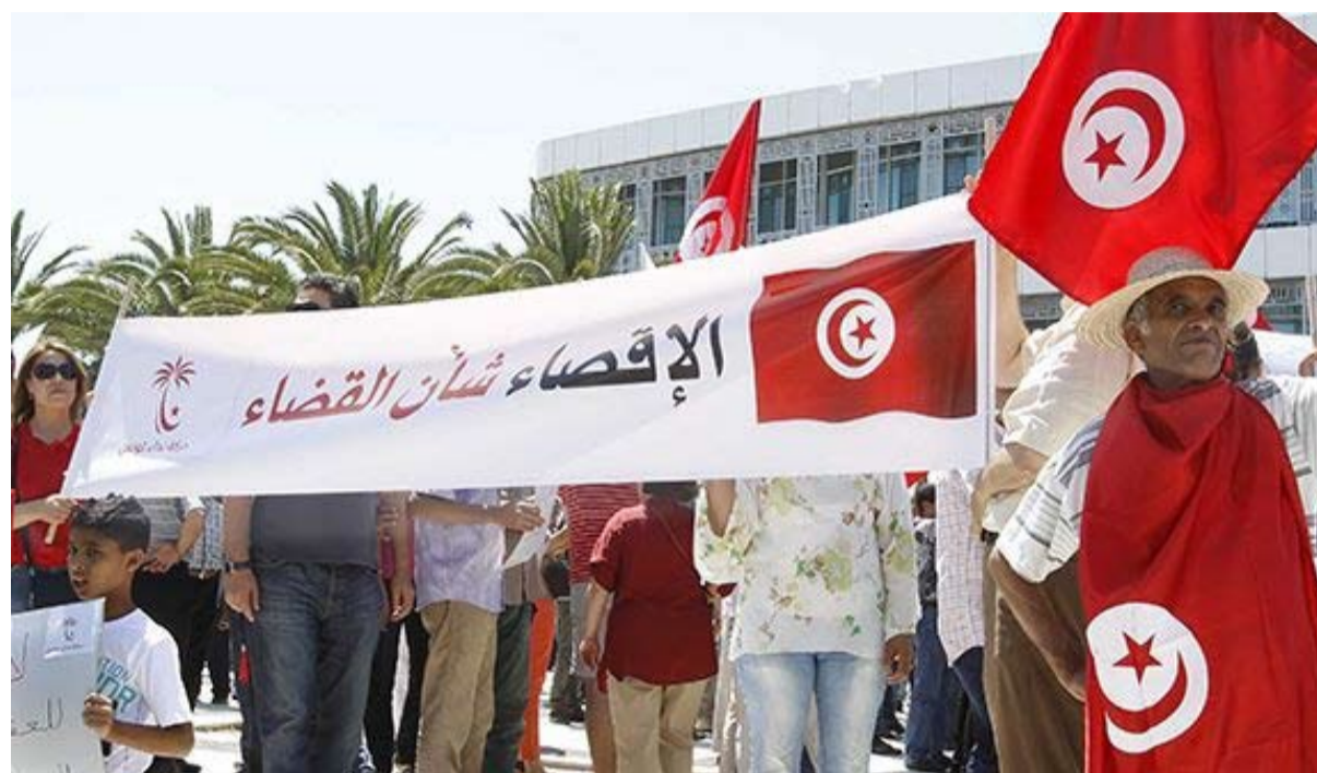
اسبوع الملفات الحارقة في تونس