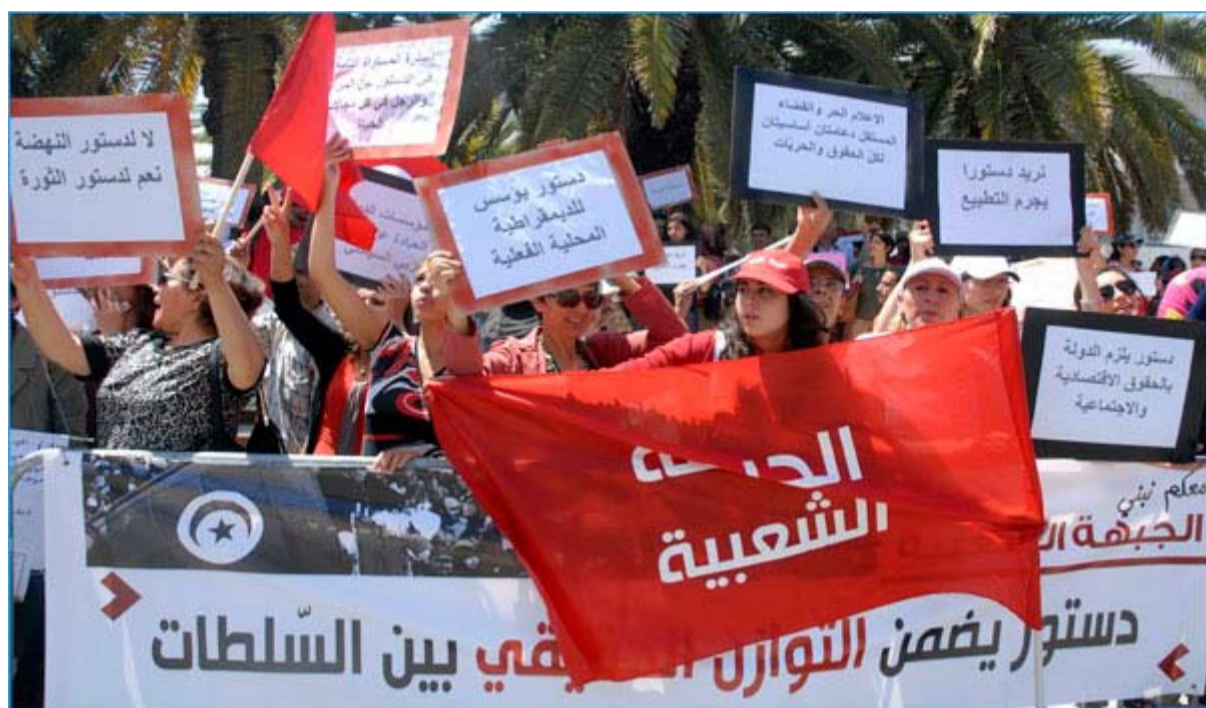
الوفاق او الفوضى والتمرد