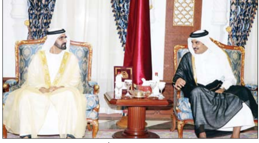
محمد بن راشد خلال اجتماعه مع أمير قطر (وام)

تنفيذا لتوجيهات رئيس الدولة توزيع ألفين و723 سلة غذائية على الأسر الباكستانية النازحة إسلام آباد-وام: تنفيذا لتوجيهات صاحب السمو الشيخ خليفة بن زايد آل نهيان رئيس الدولة حفظه الله... بدأت إدارة المشروع الإماراتي لمساعدة باكستان توزيع ألفين و723 سلة غذائية على الأسر النازحة من العمليات العسكرية في عدد من المناطق الباكستانية. وقالت إدارة المشروع أن المبادرة تنفذ بالتعاون مع هيئة الهلال الأحمر الإماراتي وتمثل المرحلة الثانية من توزيع المساعدات الغذائية على الأسر النازحة وجه بزيادة عدد الأطفال المستفيدين من حملة كسوة مليون طفل محروم حول العالم محمد بن راشد: العطاء في الإمارات لا يعرف حدوداً ولا يتوقف عند رقم دبي-وام: وجه صاحب السمو الشيخ محمد بن راشد آل مكتوم نائب رئيس الدولة رئيس مجلس الوزراء حاكم دبي بزيادة عدد المستفيدين من حملة محمد بن راشد آل مكتوم لكسوة مليون طفل محروم حول العالم وذلك بعد تخليها حاجز المليون طفل مستفيد مع مرور 10 أيام فقط على إطلاق الحملة التي من المقرر أن تستمر حتى 19 من رمضان والذي يصادف يوم العمل الإنساني الإماراتي. ويأتي هذا التوجيه في ضوء حرص سموه على وصول الكسوة لأكبر عدد ممكن من الأطفال المحرومين وفي أكبر عدد ممكن من الدول حول العالم وفي ضوء التفاعل الكبير الذي حظيت به المبادرة منذ إطلاقها من مختلف أطياف المجتمع ومؤسساته. (التفاصيل ص 2)